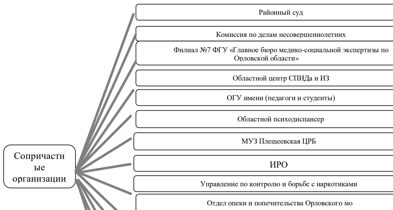
Рисунок 3. Структура взаимодействия ППМС-центра с учреждениями различных ведомств.

Рисунок 3 демонстрирует широту контактов центра, что позволяет успешно решать задачи центра, обеспечивает научно-методическое сопровождение образовательного процесса и др.